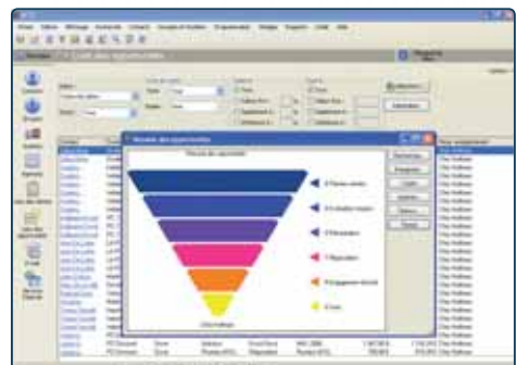
Act! by Sage maakt het mogelijk om efficiënt de commerciële activiteit van uw onderneming te sturen.